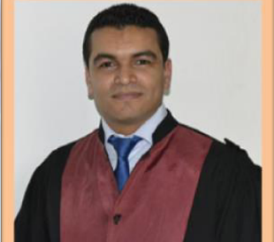
الدكتور عادل تميم " آفاق السياسات العمومية ما بعد أزمة فيروس كورونا المستجد ؟ "