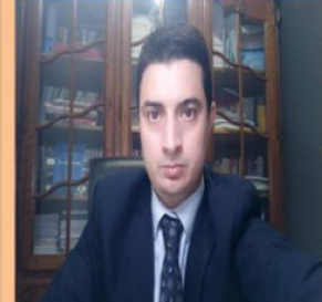
الدكتور مصطفى الغشام الشعبيبي " تداعيات جانحة كوفيد 19 على العقود المدنية والتجارية "