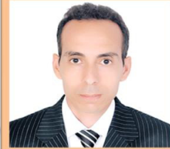
الدكتور عمر السكتاني "مدى الحاجة إلى إصلاح عميق لنظام صعوبات المقاوله"