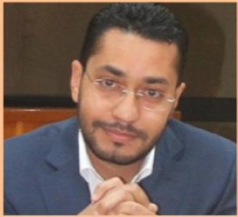
الدكتور الحسن الرشدي " الجماعات الترابية بعد جائحة كوفيد 19 : الإكراهات والتحديات "