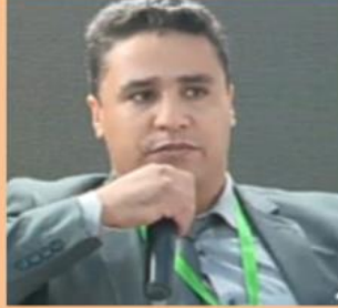
الدكتور محمد الغواطي " تعديل قانون مالية السنة لمواجهة آثار جائحة كورونا لبناء مجتمع ما بعد كورونا "